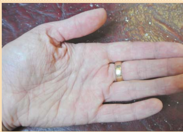
Рис. 3. Гиперлинеарность ладоней при ксерозе.