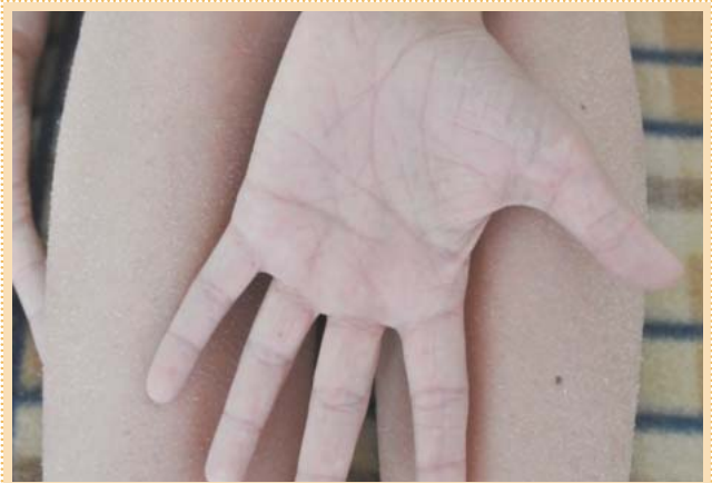
Рис. 4. Гиперлинеарность ладоней и пластинчатое шелушение кожи бедер при ксерозе.