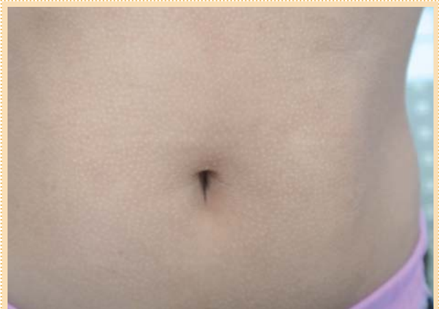
Рис. 6. Акцент фолликулярного рисунка при ксерозе кожи.