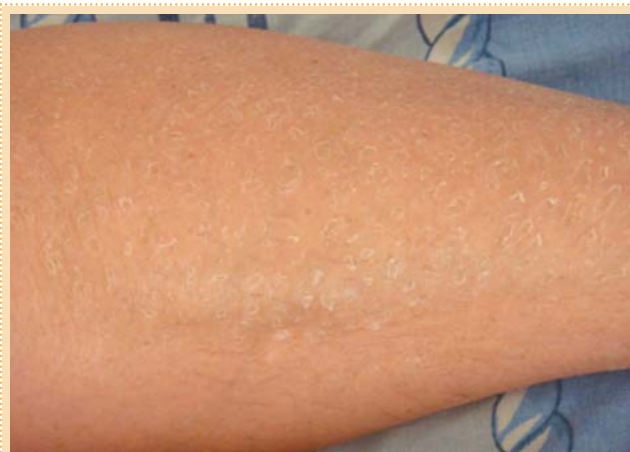
Рис. 1. Пластичатое шелушение кожи при ксерозе.

Целостность и непроницаемость рогового слоя во многом зависят от скорости десквамативных процессов, происходящих в поверхностных слоях кожи. Основными компонентами корнеодесмосом, соединяющих роговые пластинки, являются белковые структуры – протеины адгезии: десмоглеин 1, десмо-