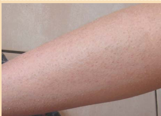
Рис. 7. Фолликулярный кератоз при вульгарном ихтиозе.