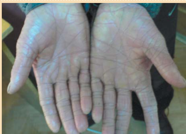
Рис. 5. Выраженная гиперлинеарность ладоней при вульгарном ихтиозе.