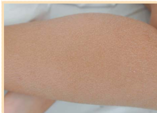
Рис. 2. Шелушение кожи при ксерозе.